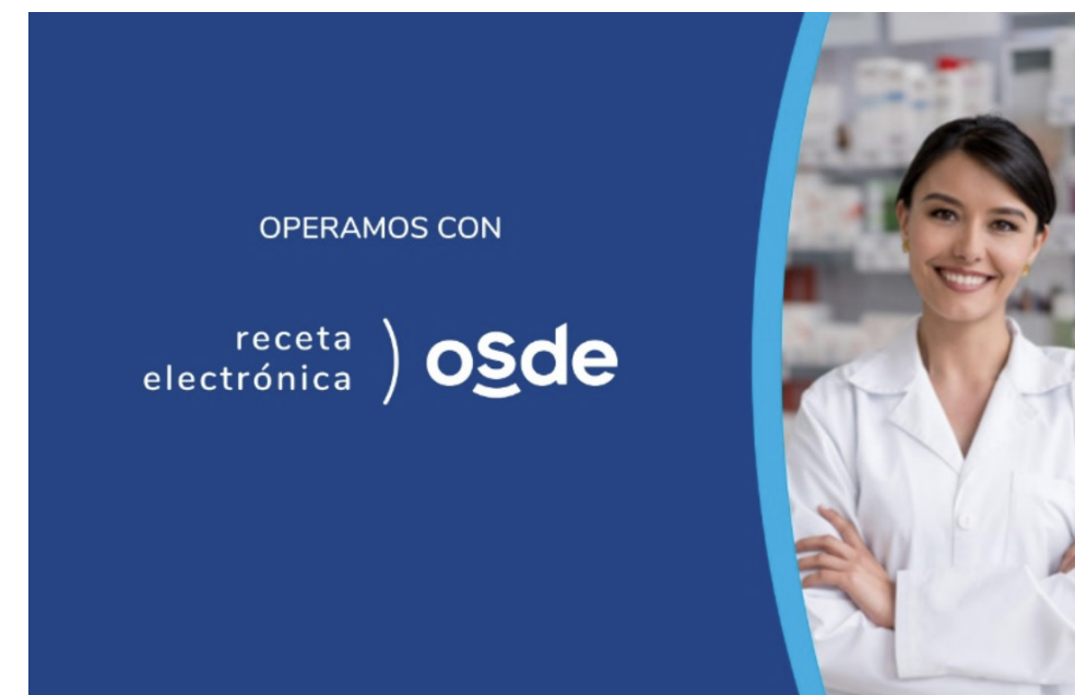
Table tent 22 x 15 cm.

receta electrónica ) osde Calco autoadhesivo